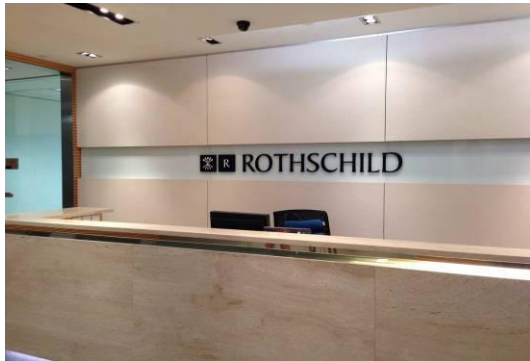
参访罗斯柴尔德集团