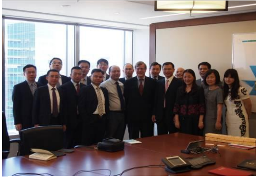
Klegar 教授分享 FICC 课程