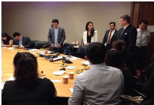
瑞士信贷 MD 介绍瑞信资产管理业务经验